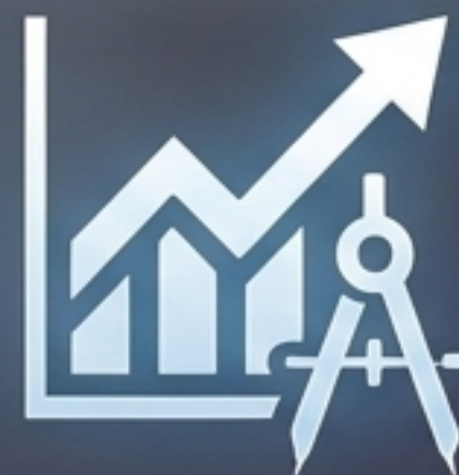
Chart Analysis (Análisis de Gráficos)

La Acción de la IA: En lugar de solo arrojar números P/E, encuentra la historia fundamental detrás del precio y te dice si cotiza por encima o por debajo de su valor intrínseco.